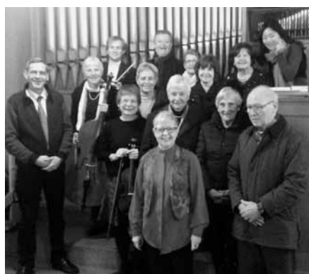
Kirchenchor St. Ottilia (Weihnachten 2018)