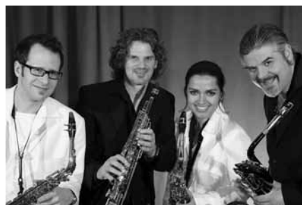
Saxophon in allen Facetten

sance, des Barock, der Klassik und der Romantik auf. Dabei entstehen völlig neue Klangwelten: abwechslungsreiche, gen-reübergreifende Musik „ohne stilistische Scheuklappen“.